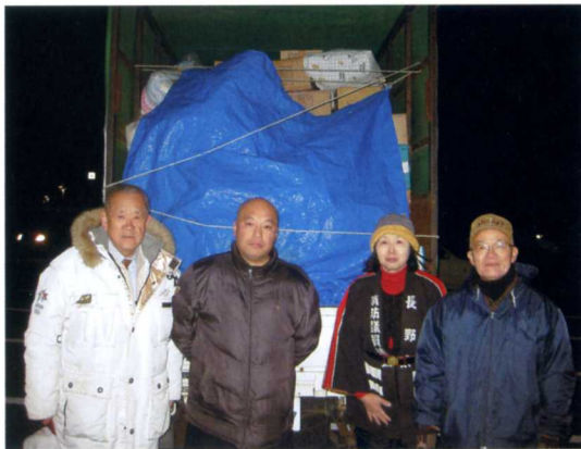
3月17日夜 福島県須賀川市体育館前で— 必要な物資を必要な所に1週間以内に直接届ける

地元の青年僧侶の方々の方々のリードで福島県内の4市に必要な物を直接届けることができました。最後の田村市は第1原発の近くで4万人の都市に8000人以上の避難された方がいて、暖をとるものでも食料でも何でも置いてほしいとの事でした。皆様の善意ありがとうございました。