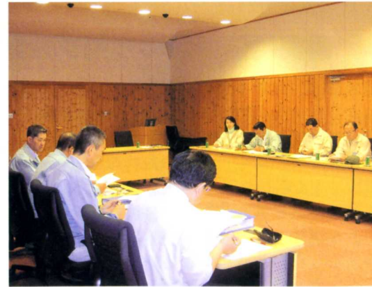
栄村役場にて—副村長より被災状況・避難状況を 伺い復興に向けて意見交換をする