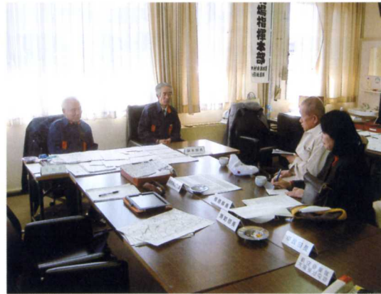
3月18日 福島県田村市役所—市長・副市長より 第1原発の事故による避難状況を聞く